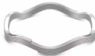
Nested Wave® Feder