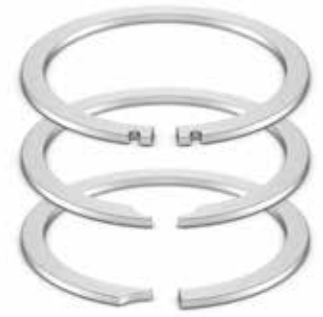
Schnappinge mit einheitlichem Querschnitt