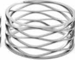
Crest-to-Crest® Wellenfeder mit parallelen Enden