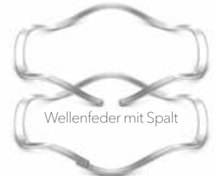
Wellenfeder mit Spalt